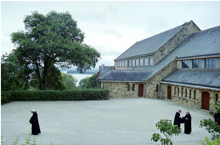
La nouvelle abbaye, en 2002

Acheminés par car depuis Ploërmel, Vannes, Sainte Anne et Lorient, vous recevrez début mai tous les renseignements nécessaires à votre réservation